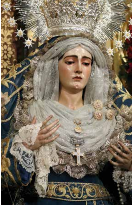
La Virgen de las Angustias ataviada para la época de adviento, fecha en la que nuestra Hermandad cedió a la Esperanza de Triana el dosel y gradas de culto para su veneración y durante las obras en su camarín

Sábado, 11 y domingo, 12: Presentación de la película del L Aniversario de la Coronación Canónica, en el salón de actos de la Casa de la cultura de Alcalá, organizándose dos pases cada día (16:30 y 18:30 horas). Este fascinante proyecto que venía realizándose desde la Cuaresma de 2020 por Metrosneto producciones, con la dirección del periodista Paco Robles, guion del profesor Manuel Jesús Roldán y locución del periodista Antonio García Barbeito, fue acogido con el calor y entusiasmo de