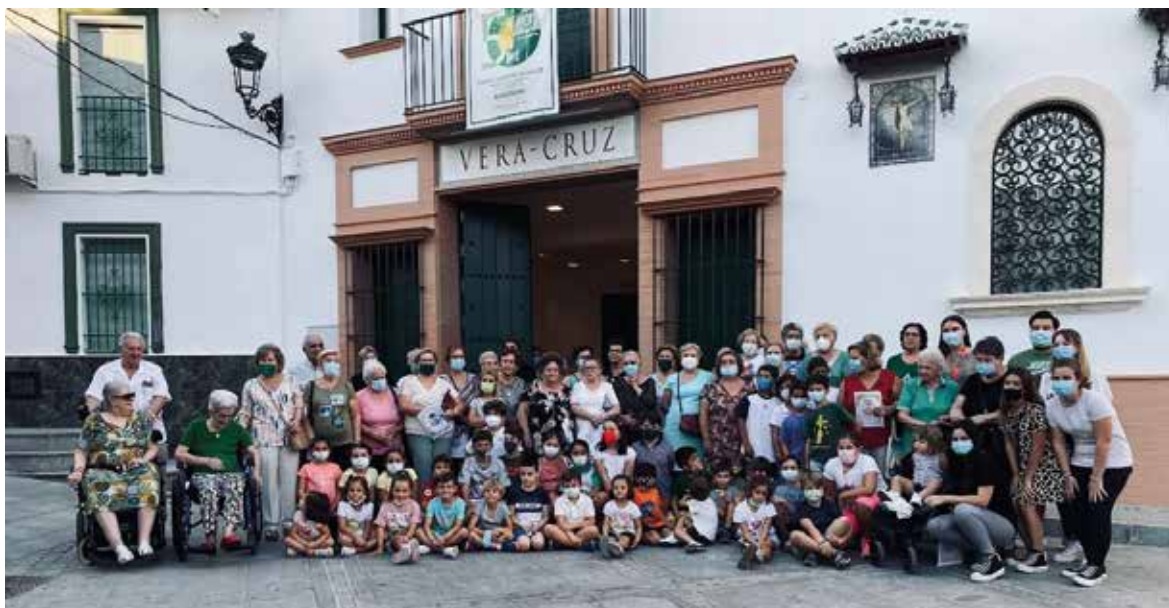
El grupo I de Formación junto al grupo “Vida de Mayores”, tan instaurado en el seno de nuestra Hermandad. Esta foto para el recuerdo supone un orgullo para nuestra corporación: testigo de Hermandad viva.

Agradecemos al grupo que lideró este proyecto en el que se contaba con Hermanos de diferentes edades, de diferente formación e índole, uniendo todos sus dones