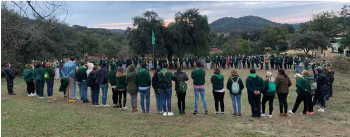
El tercero de los cuatro turnos programados por el Campamento Vera-Cruz aglutina a Hermanos a partir de 25 años y supone otra experiencia y ejemplo de Hermandad unida.

a conformar algo tan inédito como lo que se fraguó y resultó, hasta tal punto que la misma fue trasladada al Círculo Mercantil de Sevilla, abriendo el curso de exposiciones 2021-2022 y donde los sevillanos quedaron prendados de todo lo que atesora la Hermandad de la Vera-Cruz, destacando el patrimonio humano que la compone. En esta exposición se expusieron todos los estrenos que la Virgen luciría en los cultos extraordinarios por el aniversario de la coronación, presentando a los hermanos y a los visitantes los exvotos que, con trabajo e ilusión, han aportado los hermanos donantes para la que es madre de Dios.